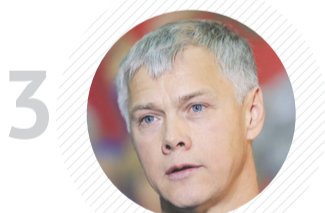
3 Комитет ГД по защите конкуренции ВАЛЕРИЙ ГАРТУНГ