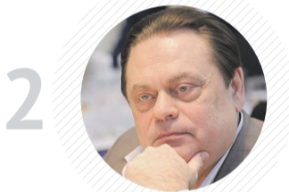
2 Комитет ГД по делам национальностей ГЕННАДИЙ СЕМИГИН