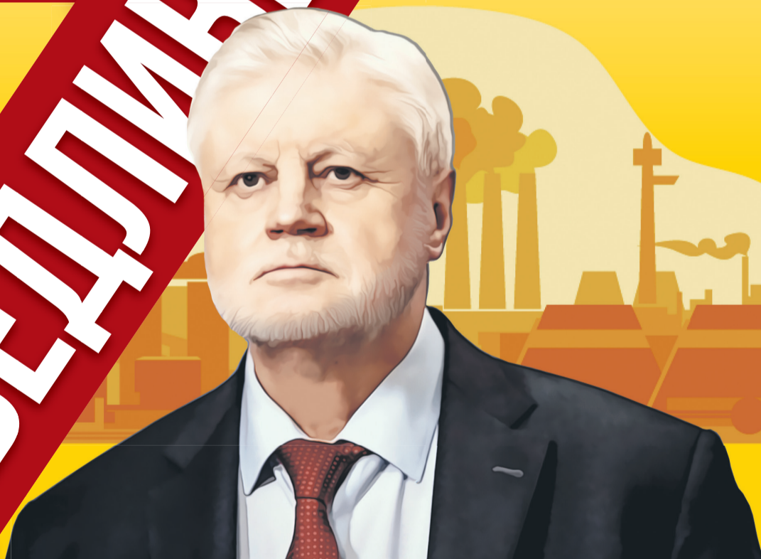
Фото: из архива Партии СРЗП, 123rf.com. Коллаж: Алексей Беленёв

Как именно Тверская область может преодолеть последствия санкций?