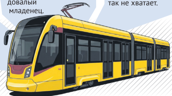
Иллюстрация: Алексей Беленев

Тверь, которая за три с лишним десятилетия потеряла 90% зеленых насаждений, задыхается в смоге! На этом фоне замена чистого электричества на выхлопные газы выглядит как приговор. Трамвай мог бы дать городу глоток кислорода, которого нам так не хватает.