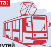
Иллюстрация: Алексей Беленев

По улицам резво бегал «крогатый» транспорт.