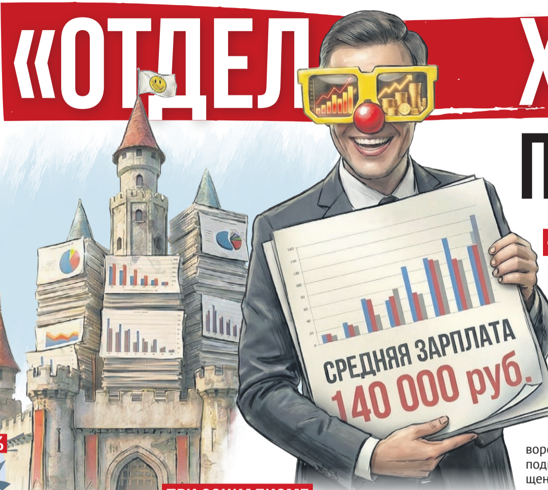
Иллюстрация: Алексей Беленев