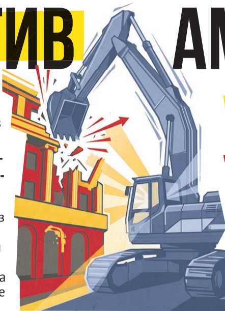
Иллюстрация: Алексей Беленёв