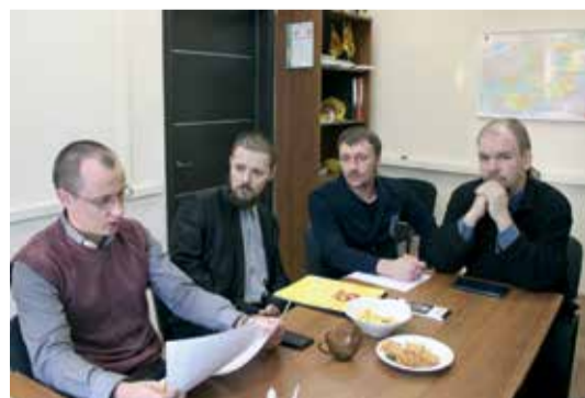
Председатели Местных отделений СПРАВЕДЛИВОЙ РОССИИ в Твери